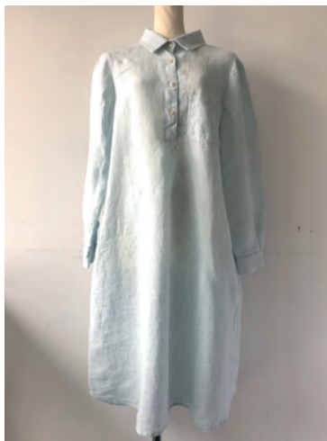
CAMILLA silver/black LINEN ¥21,000