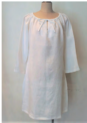
FANNY LINEN ¥23,000 SILK ¥38,000