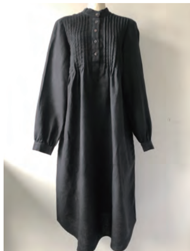
SOPHIE white/blue/black LINEN ¥18,000

日々の生活に寄り添い、彩りを添えるアイテムを素材にこだわってお作りしています。 リトアニアのリネンを使用し、動きやすくエレガントなワンピースタイプをご用意いたしました。