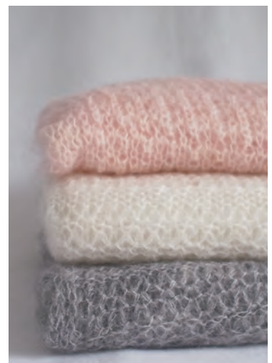
THROW white/grey/pink ¥22,000