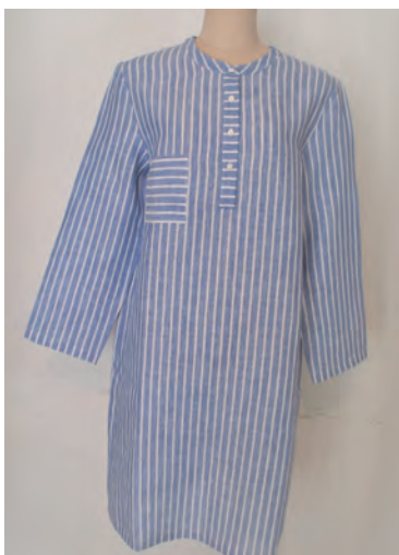
VALERIA white/blue stripe LINEN ¥24,000