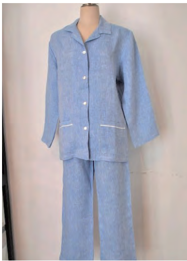
HELENE white/blue LINEN ¥29,000

デザイナー自身が着たいホームウエアが見つからず、作り始めたのがきっかけでブランドを立ち上げました。シルエットの美しさやディテールへのこだわりでフレンチシックの神髄を感じます。リネン、シルク、コットンサテンといったノーブルで素晴らしい感触を持つ素材をセレクトし、ブティック奥のアトリエで一枚一枚丁寧に仕立て上げているほんとうの意味での<Made in Paris>。