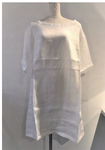
EMILIA white/green LINEN ¥24,000